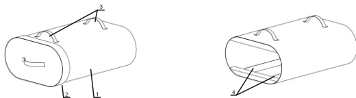
Рис.1 Конструкция духовки